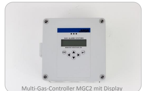
Multi-Gas-Controller MGC2 mit Display