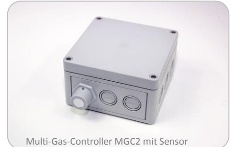
Multi-Gas-Controller MGC2 mit Sensor