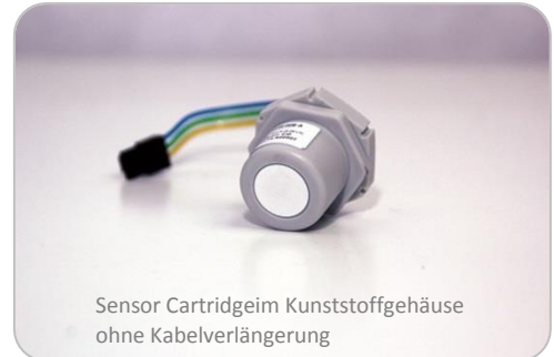
Sensor Cartridge im Kunststoffgehäuse ohne Kabelverlängerung